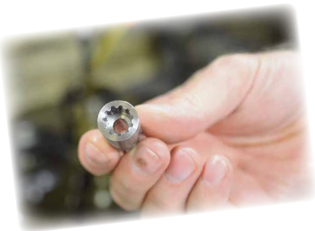
Borrar från Mitsubishi's kända MPS/MPS1-Serie, antagligen Mitsubishi's mest sålda borrar då den är mycket populär pga. av sina egenskaper som bra prestanda, precision, livslängd och pålitlighet.