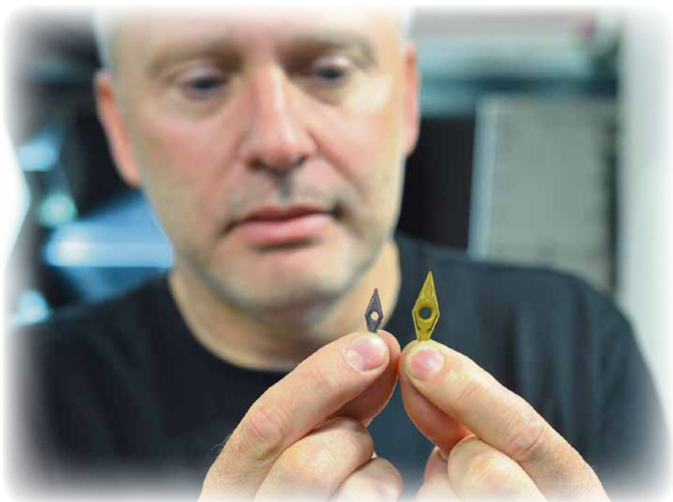
Betydligt mindre hårdmetall förbrukas i dagsläget, detta ger mycket bra hållbarhet, tack vare skärens mindre dimension så sparas det både på slantar och miljön.